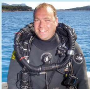
Président Benoit PHILIPPS